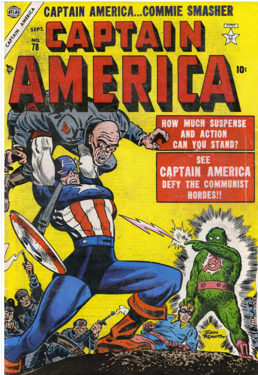
Captain America contre Electro (John Romita Sr., 1954, Impression quadrichromique, 19,7cm x 26,7cm, États-Unis d'Amérique).

Répondre aux questions sur la couverture de Captain América.